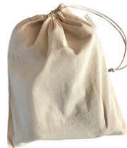
SAC EN CANEVAS Dimensions : 30,5 cm x 38 cm (12 po x 15 po)