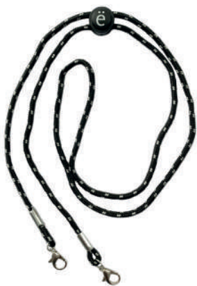
CORDON DE SERRAGE AJUSTABLE (BLANC ou NOIR)

Les sacs servent d'emballage pour le rangement, le transport et le lavage de votre masque usagé ou propre. Fabriqués à 100 % en coton naturel certifié GOTS, les sacs en toile et en filet transportent de 1 à 5 masques. Les pochettes de transport zippées contiennent de 1 à 2 masques et sont offertes en deux teintes réalisées avec des encres certifiées OEKO-TEX.