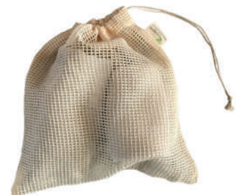
SAC EN FILET (de lavage) Dimensions : 30,5 cm x 38 cm (12 po x 15 po)