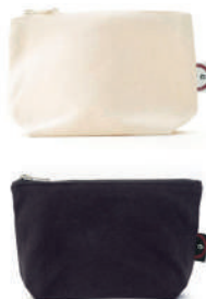
POCHETTE DE TRANSPORT Dimensions : 11 cm x 14 cm (4,3 po x 5,5 po)